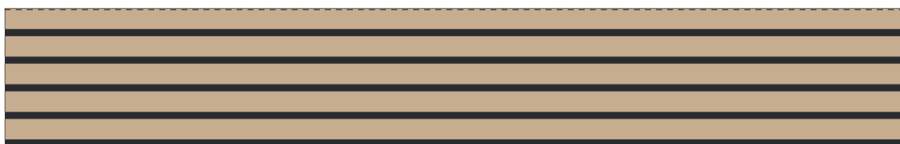
Panel akustyczny FLAT 400x2600 (5 lameli)